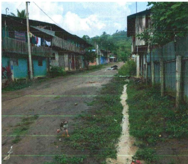
Foto 02. Imagen muestra las condiciones del sistema de drenaje pluvial.