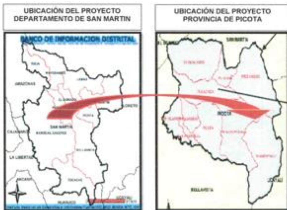
UBICACIÓN DEL PROYECTO DISTRITO DE TRES UNIDOS