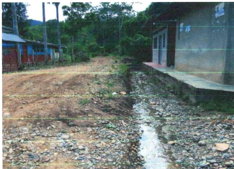
Foto 01 muestra las condiciones del sistema de drenaje pluvial

A continuación, se presentan fotografías con las características del cauce que está operando actualmente: