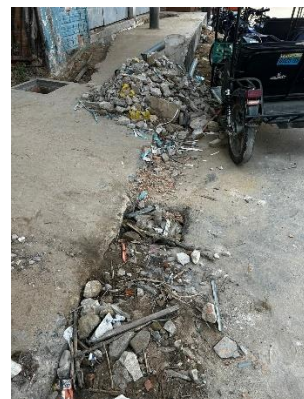
Figura N° 03