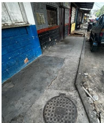
Figura N° 01

La UPS calle Angamos cuadra 06. en la actualidad la calzada no se encuentra en buenas condiciones, cuenta con veredas que no satisface la necesidad funcional de circulación del peatón, considerando así, construir veredas en la longitud de la vía con el fin de mejorar las condiciones de transitabilidad del peatón. En la calle Angamos, cuadra 06, no cuentan con veredas construidas, la falta de este activo estratégico no ha permitido que los pobladores cuenten con las condiciones de transitabilidad y seguridad vial óptimas, ocurriendo accidentes, principalmente, de adultos mayores y niños. asimismo, las partículas de polvo suspendidas en el aire en los tramos sin veredas construidas, provocan infecciones respiratorias en los pobladores. La UPS la calle Angamos, cuadra 06, no cuentan con condiciones adecuadas que permitan brindar un servicio de movilidad peatonal urbana en óptimas condiciones a los pobladores.