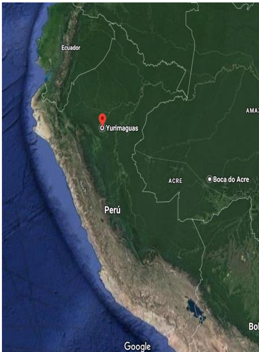
Figura N° 06