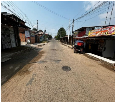
Figura N° 04

La calle Angamos, cuadra 06 del distrito de Yurimaguas cuentan no con guías de circulación (Señales verticales que indiquen Lugar, Calle y/o Pasaje, Sentido de flujo vehicular). Además de señalización horizontal (informativas, preventivas y reglamentarias).