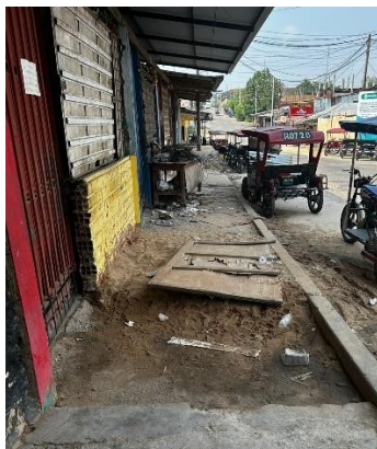
Figura N° 02