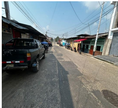
Figura N° 05