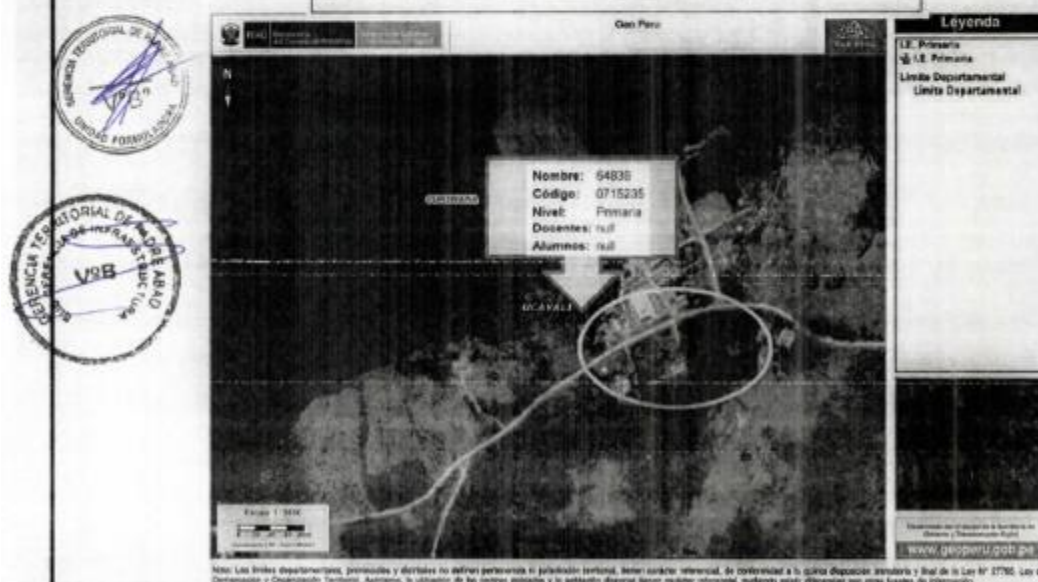
Ilustración 1. Vista Satelital de la Ubicación de la IE en el Centro Poblado Nuevo Satipo.