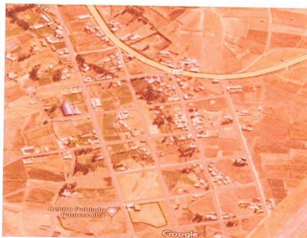
Mapa de Ubicación del centro poblado Pataccocha

La prestación será en la zona urbana del distrito de José María Arguedas, PROVINCIA DE ANDAHUAYLAS, DEPARTAMENTO DE APURÍMAC.