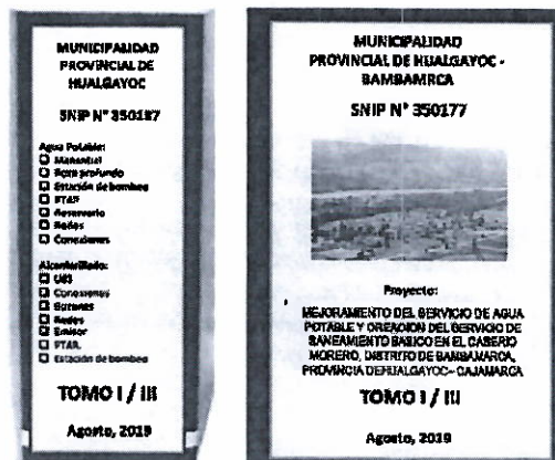
Figura 01: Forma de Presentación del Expediente Técnico (Referencial)

Los expedientes deberán ser presentados en archivadores de palanca de lomo ancho. Cada archivador deberá considerar una carátula en la parte frontal y en lomo del mismo, para una rápida verificación. Se recomienda que dichas carátulas, deberán indicar como mínimo, lo indicado en la figura 1.