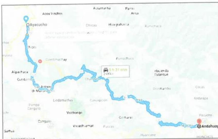
Imagen 01. Tramo 1: Ayacucho – Andahuaylas