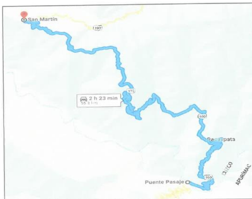
Imagen 04. Tramo 4: Puente Pasaje – C.P. San Martín