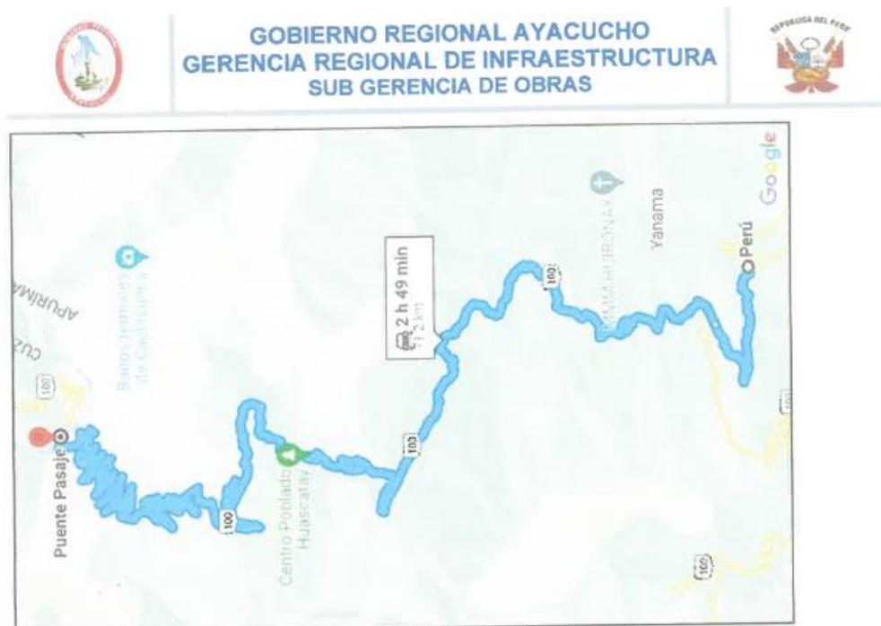
Imagen 03. Tramo 3: Div. Matapuquio – Puente Pasaje