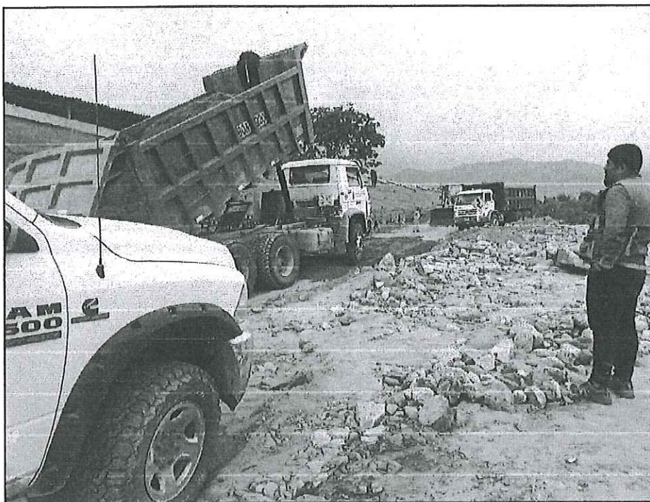
Foto N° 04: Vía vecinal Huambacho - Zona: Caserío Huambacho - Día: 11/04/2023.