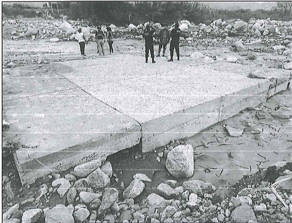
Foto N° 01: Vía vecinal Huambacho - Zona: Caserío Huambacho - Día: 08/04/2023.

El día 06 de abril del 2023, las intensas lluvias provocaron nuevamente el desborde del Río Loco en el Sector Huarcos, lo que produjo la activación de la Quebrada Mishti, la cual atraviesa a la vía vecinal Moro – Huambacho en el sector del mismo nombre. El cauce del desborde del río llega al sector Huambacho, encauzándose por la carretera, socavando el terreno natural, y arrastrando piedras grandes, bloqueando por completo el acceso en dicho sector.