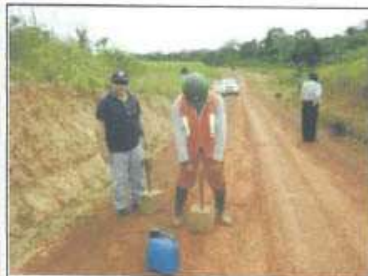
Foto 02: Compactación de Baches (Bacheo), en un Mantenimiento Rutinario.