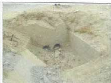
Foto 04: Ingreso de alcantarilla de desfogue en inicio de tramo, dos tuberías Ø 8" cada una. Cabezal de ingreso en malas condiciones y obstruido.