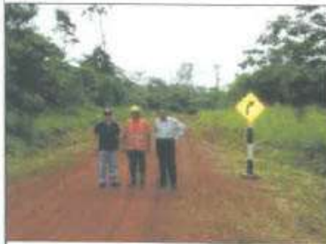
Foto 03: Señalización Preventiva.