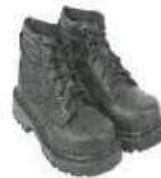
Zapato de seguridad Puntera Acero