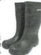
Bota de Jebe