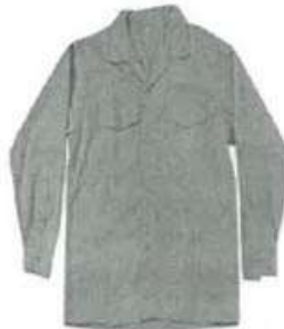
Uniforme de Mantenimiento