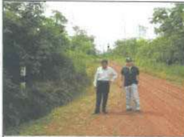
Foto 01: Kilómetro de inicio (00+000 km.) de la Carretera Vecinal. Hito Kilométrico