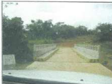
Foto 05: Puente de Concreto, en servicio. Con Plataforma, Veredas y Barandales en buen estado operativo.