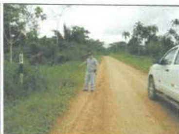
Foto 06: Hito Kilométrico (Señalización). Cercano al Final de la carretera.