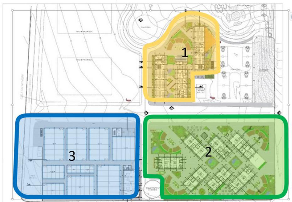
GRÁFICO: MASTER PLAN DE LA PROPUESTA