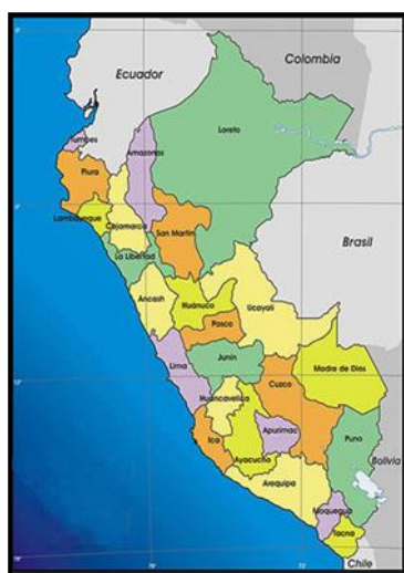
Mapa de macro localización del Perú

La zona de intervención del proyecto está ubicada en la parte sur oeste de la ciudad de Pucallpa, perteneciendo a la zona urbana de la ciudad.