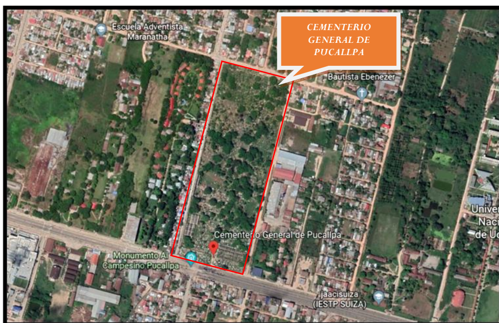
Fig. N° 01: Ubicación del proyecto