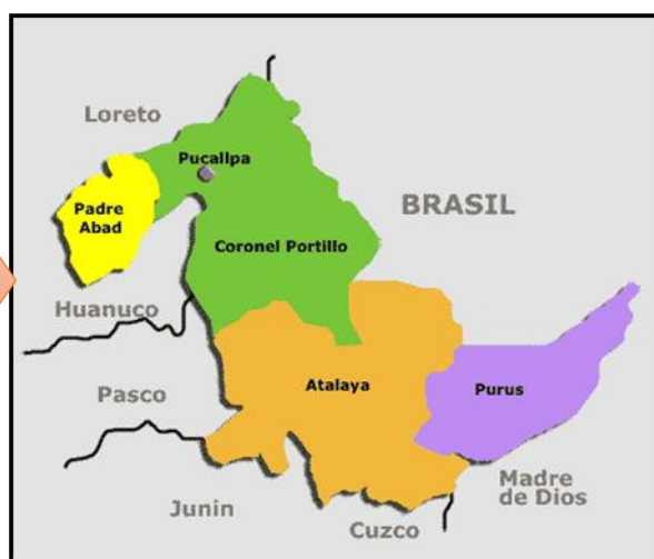
Mapa macro localización del departamento de Ucayali