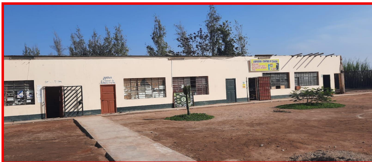
Imagen N° 04- vista frontal de área administrativa