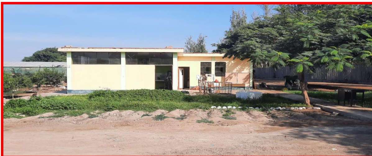
Imagen N° 06- vista frontal de laboratorio de veterinaria