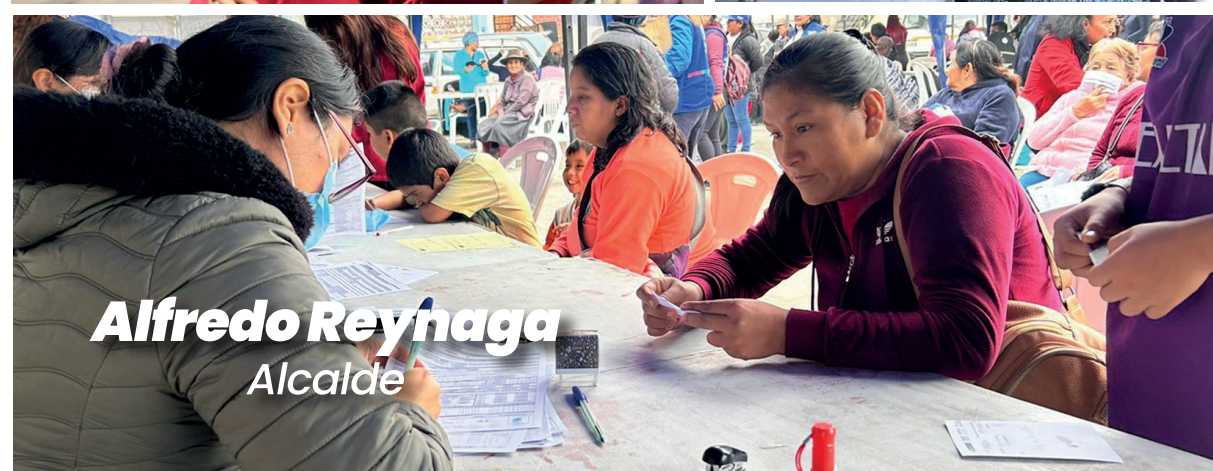
Alfredo Reynaga Alcalde

400 VECINOS BENEFICIADOS con Ecografías Gratuitas