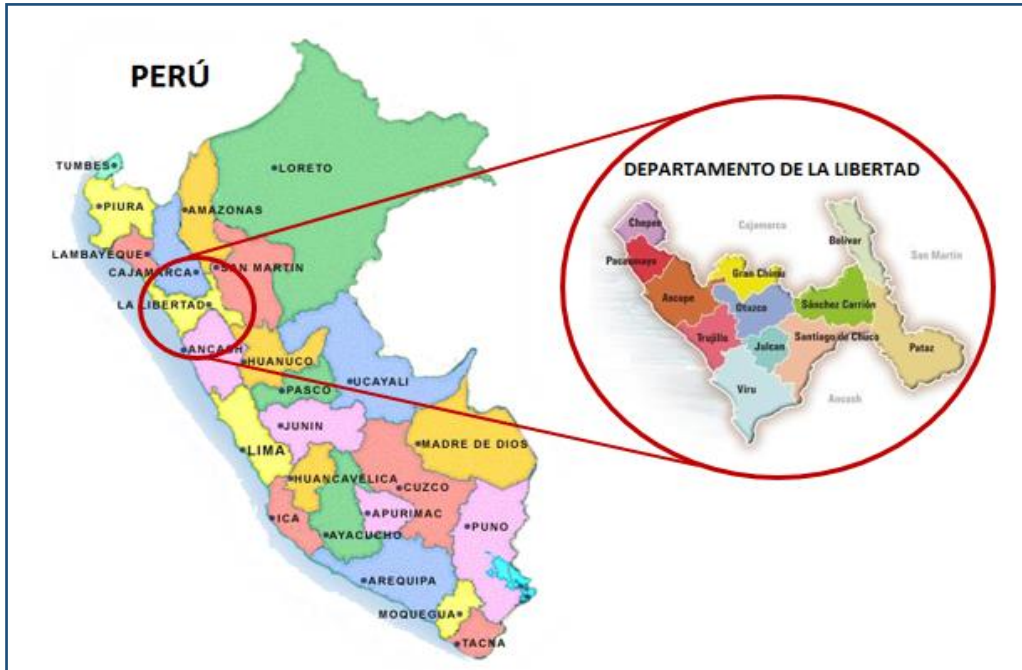
FIGURA 01: Ubicación Geográfica de la Región La Libertad