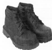
Zapatos de Seguridad con Puntera de Acero