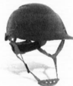
Casco de Seguridad