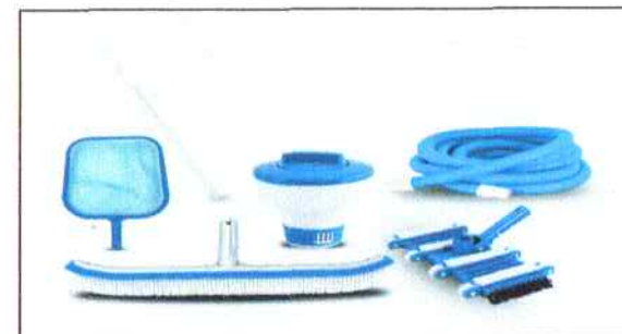
Figura 01: Kit de limpieza

Asimismo, esta partidas corresponde al acápite a la selección y colocación por parte del Contratista de todos los elementos de accesorios para las distintas conexiones de tuberías debidamente utilizada y recubierta con geotextil o pegamento para PVC para evitar la fuga de aguas al cual se esté utilizando estos accesorios, deben cumplir Normas Técnicas para este los distintos trabajos que se realizarán con estos elementos, serán totalmente nuevos y de buena marcas cumpliendo los estándares como una piscina olímpica. La mano de obra será calificada para estos tipos de trabajos. El Contratista será el responsable de la adquisición e instalación de estos accesorios en obra.