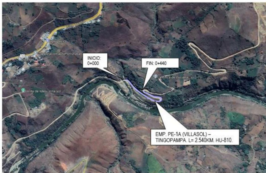
TRAMO 4: EMP. HU-810 - EMP. R1001184 (CRUCE TINGOPAMPA). L=0.44 KM. S/C

JR. 28 DE JULIO NRO. 1363 INT. 1367-Huanuco E-mail: ivp_huanuco_2018@outlook.com