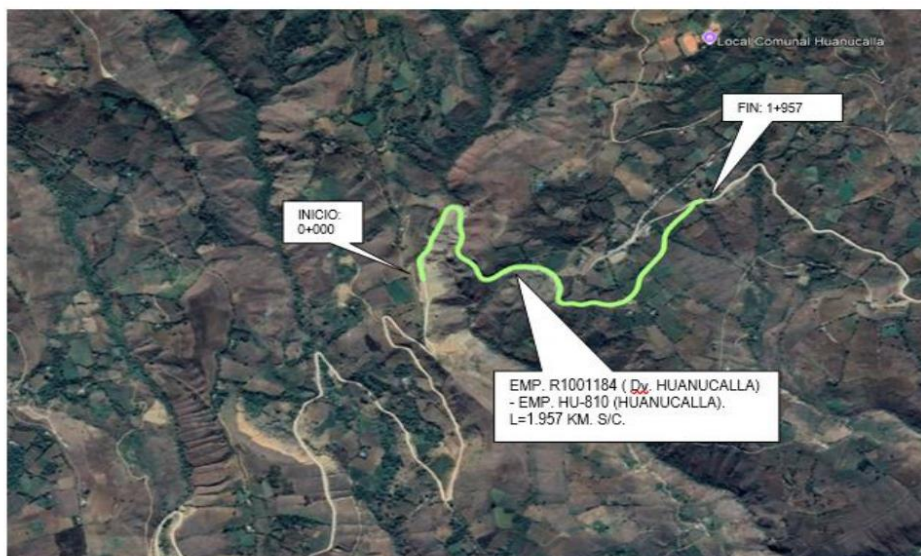
TRAMO 6: EMP. R1001184 (DV. HUANUCALLA) - EMP. HU-810 (HUANUCALLA). L=1.957 KM. S/C