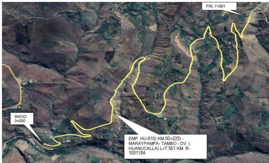
TRAMO 3: EMP. HU-810 (KM 00+225) - MARAYPAMPA- TAMBO - DV. (HUANUCALLA). L=7.561 KM. R-1001184

"Decenio de la Igualdad de Oportunidades para Mujeres y Hombres" "Año de la unidad, la paz y el desarrollo"