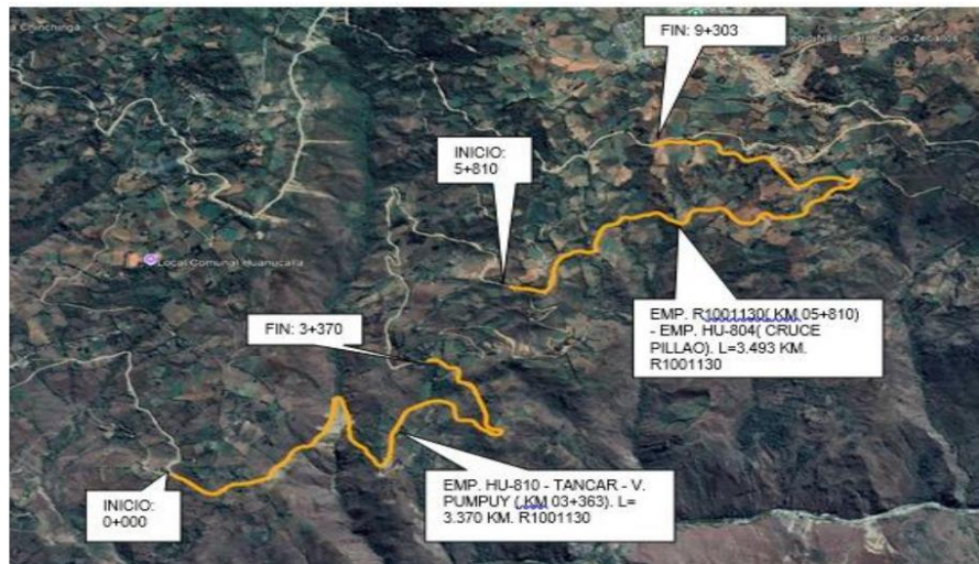
TRAMO 2: EMP. HU-810 - TANCAR – DV. PUMPUY (KM 03+363); EMP. R1001130 (KM 05+810) – EMP. HU-804 (CRUCE PILLAO).

JR. 28 DE JULIO NRO. 1363 INT. 1367-Huanuco E-mail: ivp_huanuco_2018@outlook.com