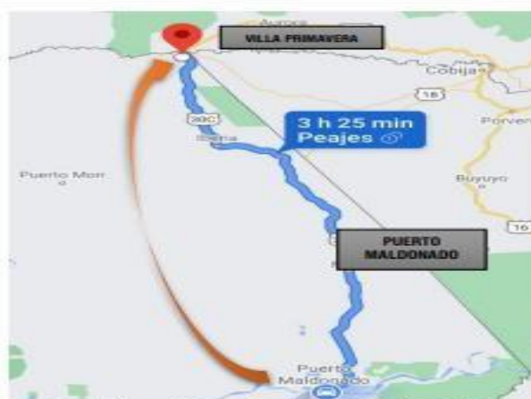
Figura 03. Puerto Maldonado-Villa Primavera