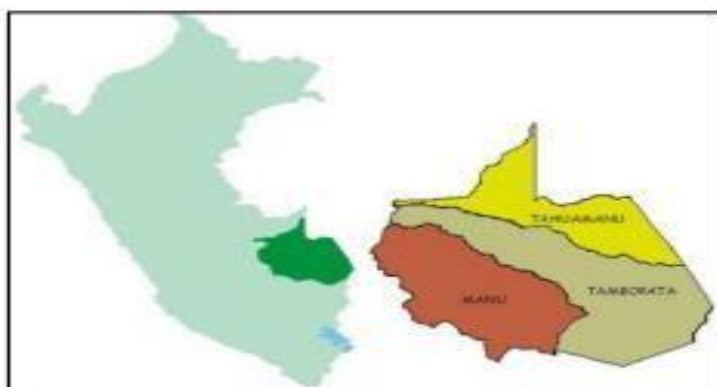
Figura 01. Departamento de Madre de Dios