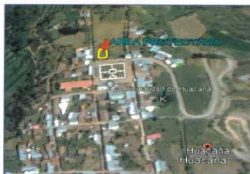
Imagen satelital de la comunidad de Huacana

GOBIERNO REGIONAL DE AYACUCHO Obra: Mejoramiento de la Capacidad Resolutiva del P.S. Huacana - Sucre - Ayacucho Ing. Wilmer Marcaya Aguilar CIP N° 295738 Presidente de Obra