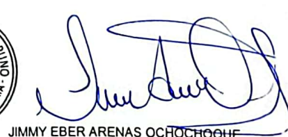
JIMMY EBER ARENAS OCHOCHOQUE