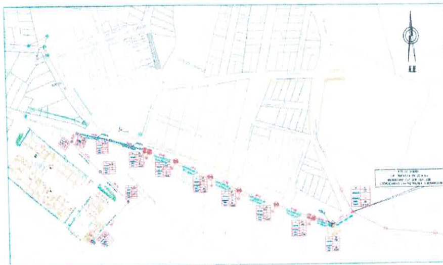
IMAGEN 01: Ubicación de la Zona de Trabajo

Distrito : CUTERVO Provincia : CUTERVO Región : CAJAMARCA