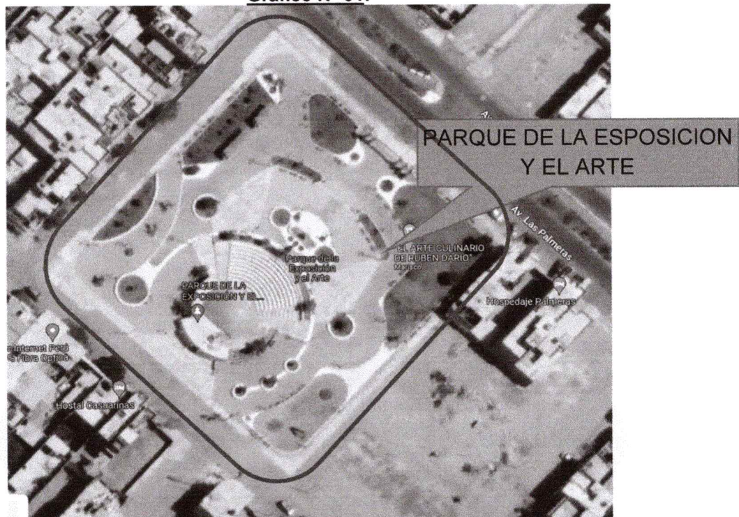
Gráfico N° 01:

Urb. Buenos Aires – Distrito de Nuevo Chimbote - Provincia de Santa.