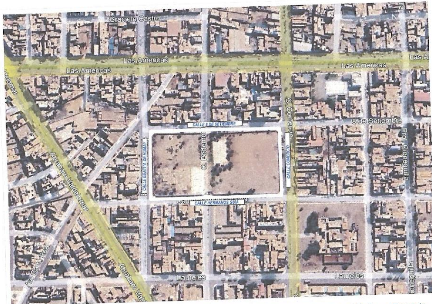
IMAGEN 1 Ubicación propuesta para el Coliseo Cerrado