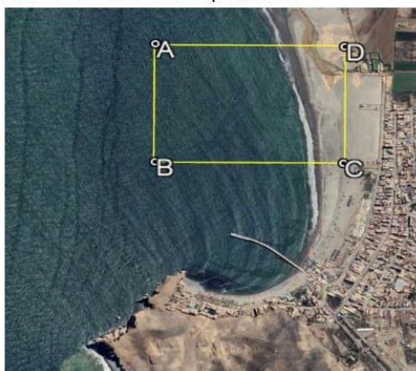
Figura 1. Área de levantamiento geofísico con Sub bottom profiler

Se debe realizar una campaña de investigación geofísica considerando la prospección geofísica usando la técnica con sub-bottom profiler. Esta exploración deberá permitir conocer la morfología del fondo marino y el perfil estratigráfico de la zona donde se colocarán los pilotes de concreto o metálicos; consideradas en el proyecto. Asimismo, esta se calibrará en función de las muestras profundas obtenidas mediante Wash Boring y mediante la toma de muestras superficiales.