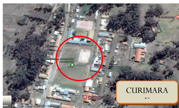
VISTA SATELITAL DEL TERRENO DEL PROYECTO

El proyecto consiste en la construcción de la infraestructura deportiva, con tecnología apropiada de acuerdo a las condiciones socioeconómicas, topográficas y geológicas teniendo en cuenta el impacto ambiental además de ello contará con: