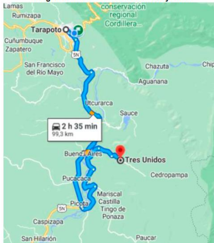
Imagen N° 3 Vías de Acceso al Proyecto.