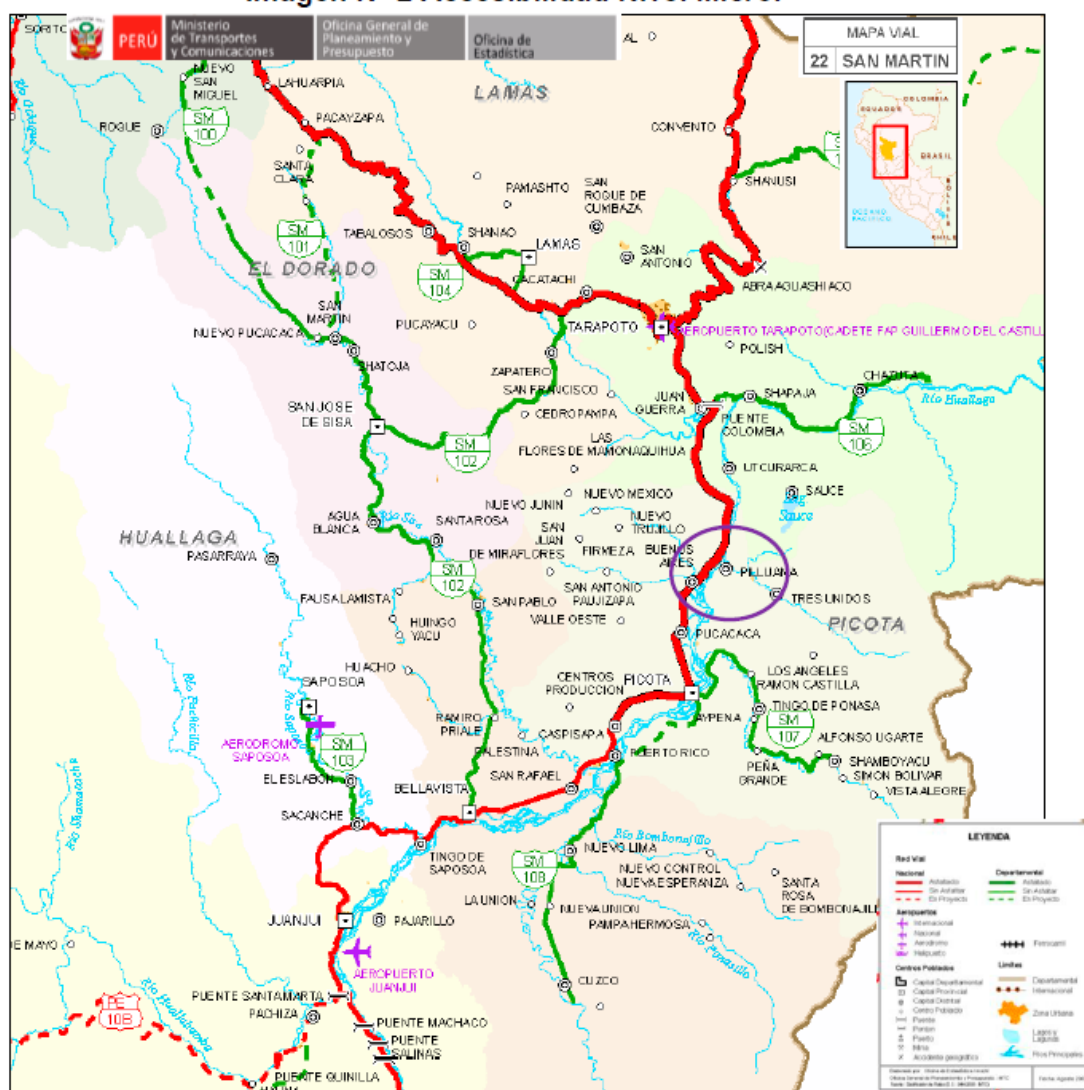
Cuadro N° 1. Vías de Acceso al Proyecto.