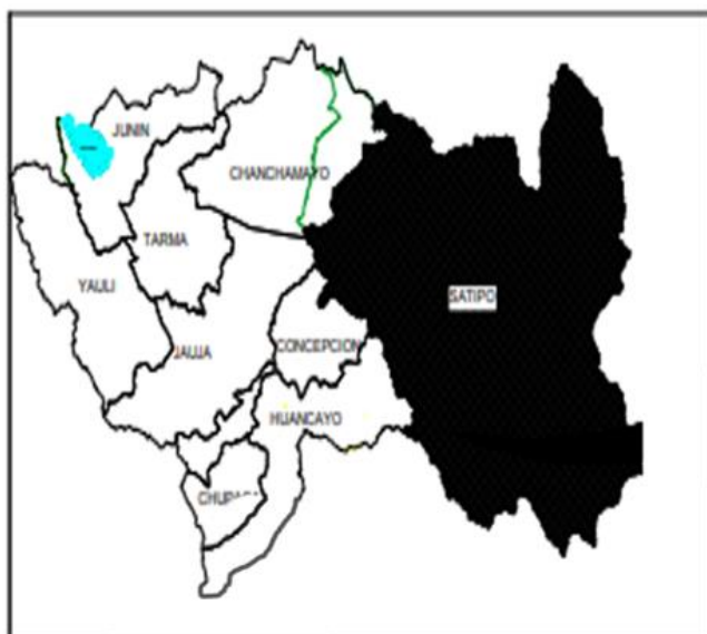
UBICACIÓN DE LA PROVINCIA DE SATIPO