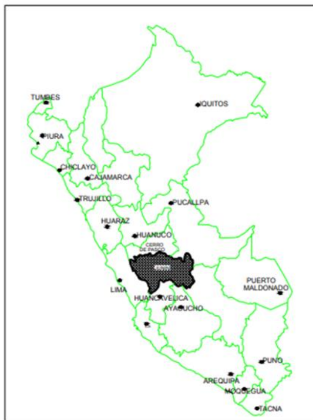
UBICACIÓN DEL DEPARTAMENTO DE JUNIN