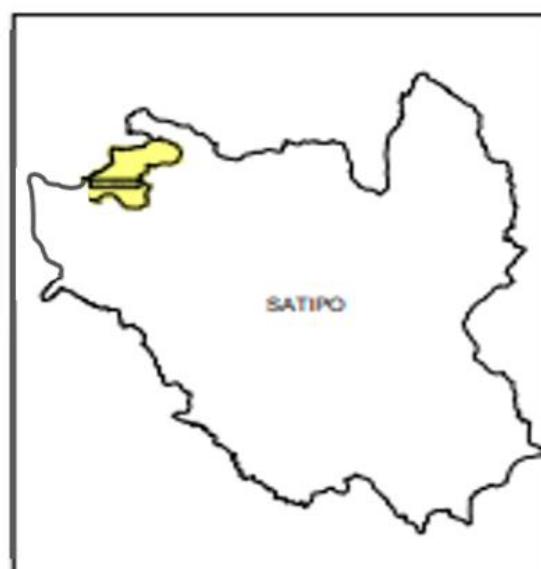
UBICACIÓN DEL DISTRITO DE RIO NEGRO