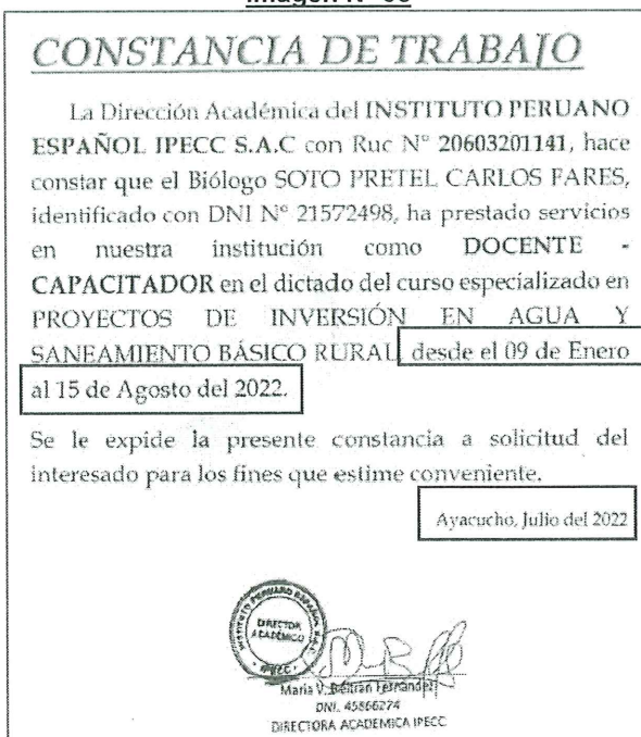
Imagen N° 03

De la experiencia 4 (folio 65 de la oferta del postor) se puede verificar que el postor presenta constancia de trabajo para docente capacitador, donde consigna que prestó servicios desde el 09 de enero al 15 de agosto del 2022 , siendo emitido el documento en julio del 2022 , tal como se aprecia en la siguiente imagen: