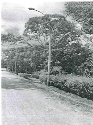
Poste de alumbrado Publico