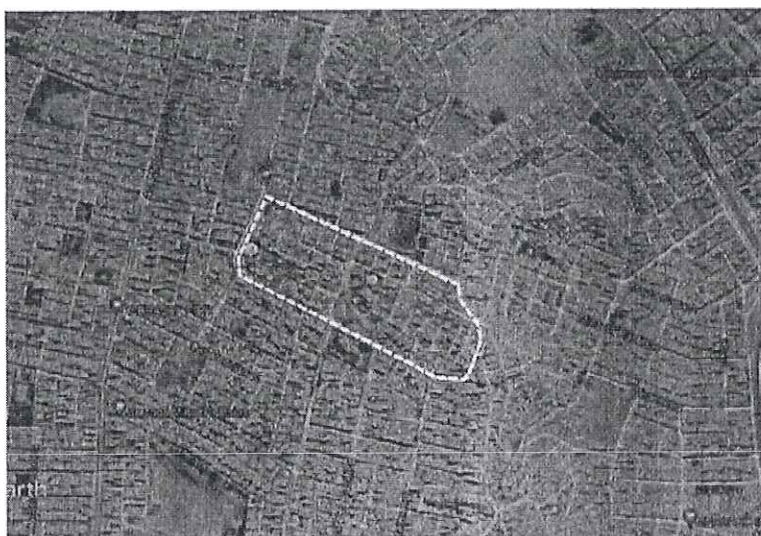
IMAGEN 1: AA. HH. Villa Solidaridad 3ra Etapa

Específicamente el lugar donde se desarrollará el proyecto IOARR de EMAPE S.A, se encuentra ubicado en las distintas escaleras que dan acceso al AA HH. Villa solidaridad 3ra etapa, Distrito de San Juan de Miraflores, Provincia Lima, Departamento Lima.