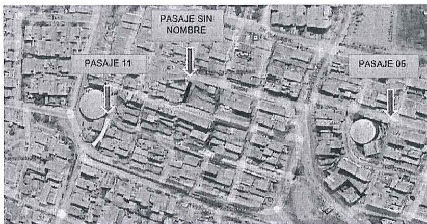
TABLA 1: Escaleras de acceso