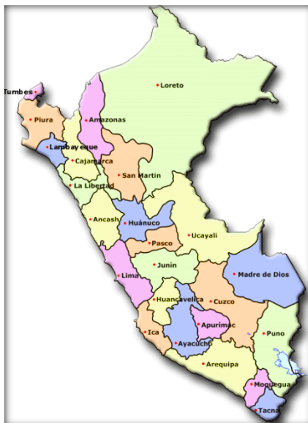
ESQUEMA N.º 1. UBICACIÓN DEL AMBITO DEL PROYECTO.