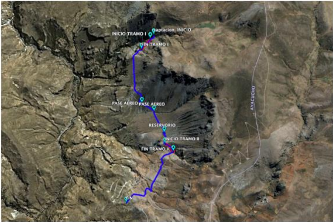
Ubicación geográfica del proyecto

Las Localidad de Upahuacho, se encuentra aproximadamente a 17 horas aproximadamente de viaje, desde la Ciudad de Ayacucho, siendo el recorrido de la siguiente manera: partiendo desde la Ciudad de Ayacucho, se recorre por la vía carretera asfaltada Ayacucho a Parinacochas (14. horas); carretera afirmada desde Parinacochas a Upahuacho (3.0 horas) y carretera asfaltada de Upahuacho Al canal de Achuani (1:30 horas).