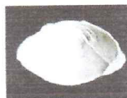
SULFATO DE ALUMINIO