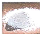
HIPOCLORITO DE CALCIO GRANULADO