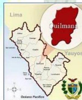
Imagen 1.3. Distrito de QUILMANA