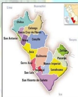
Imagen 1.2. Provincia de CAÑETE