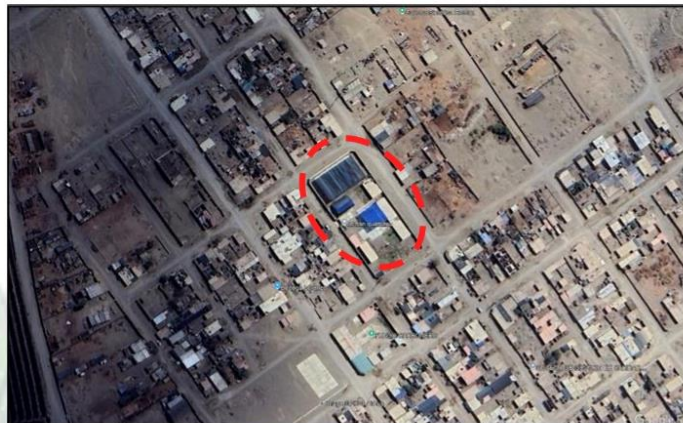
I.E.P. DE INTERVENCIÓN

“Año de la recuperación y consolidación de la economía peruana”