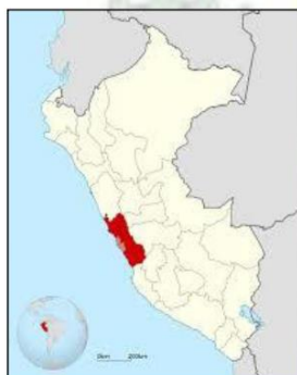
Imagen 1.1. Departamento de LIMA