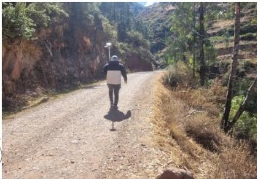
Fotografía 5: Vista de la progresiva 0+000

MUNICIPALIDAD DISTRITAL DE HUAMBALPA VILCAS HUAMÁN - AYACUCHO Ing. [Firma] Subgerente de Infraestructura y Mantenimiento Vial