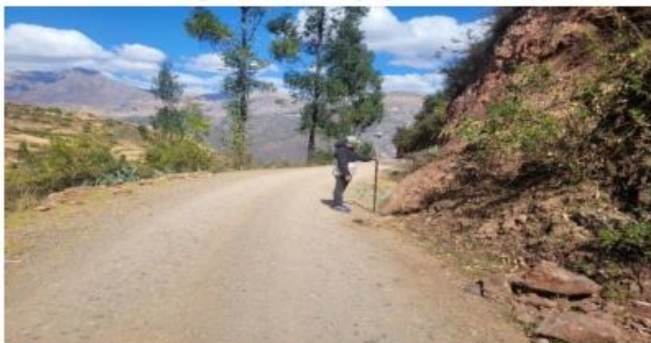
Fotografía 6: Vista de la progresiva 0+000

Progresiva 0+000 se visualiza la superficie de rodadura el cual cuenta con una topografía no accidentada