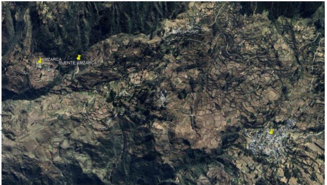
Imagen 1: Zona de ubicación de la región Ayacucho

MUNICIPALIDAD DISTRITAL DE HUAMBALPA CALLE SAN JUAN DE LOS RIOS N° 1250 TEL: 053 226 411 111 FAX: 053 226 411 112 E-MAIL: info@huambalpa.gob.pe Sub-Comité de Evaluación y Selección de Postulantes