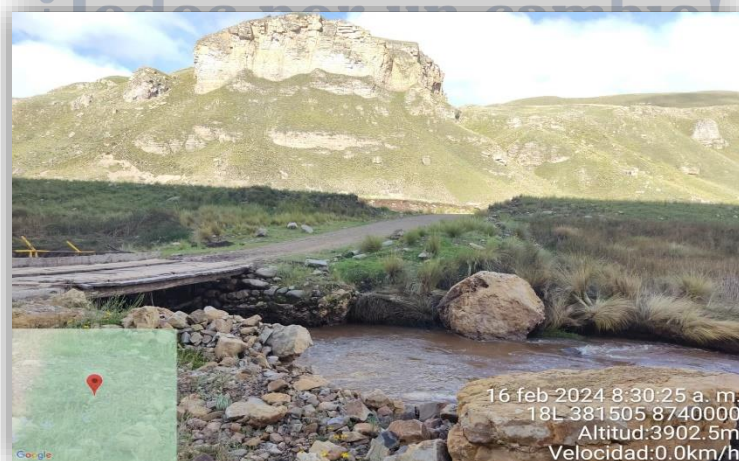
Fig. 4: Vista Actual del Puente