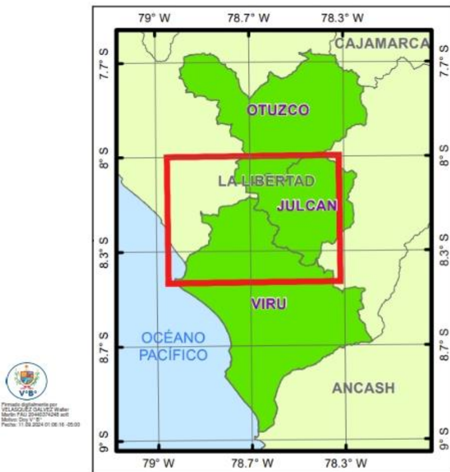
MAPA DE UBICACIÓN DE LAS PROVINCIAS DE VIRÚ, JULCÁN Y OTUZCO