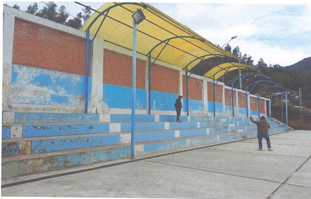
Imagen N°01. Situación actual losa deportiva existente en Parobamba alto

La situación se agrava en las temporadas de invierno (noviembre - abril), ya que, al no contar techo que permita a realizar el deporte y actividades todo el tiempo. En la siguiente imagen se puede ver el estado actual de la losa existente.