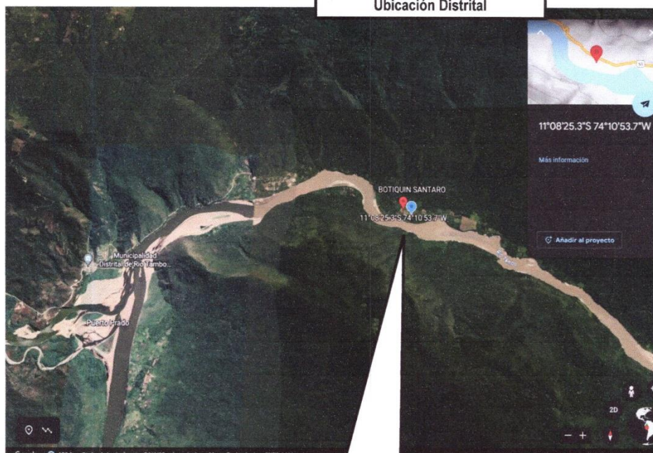
Ubicación Distrital-Valle de Río Tambo-CN Santaro