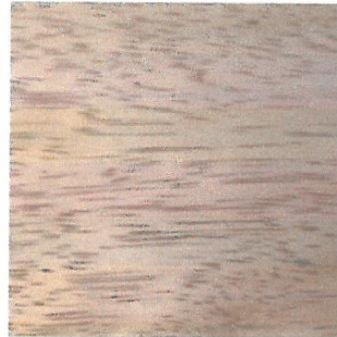
MACHIHEMBRADO(AGUANO)- IMAGEN REFERENCIAL

Año del Bicentenario de la consolidación de nuestra independencia y de la conmemoración de las heroicas batallas de Junin y Ayacucho