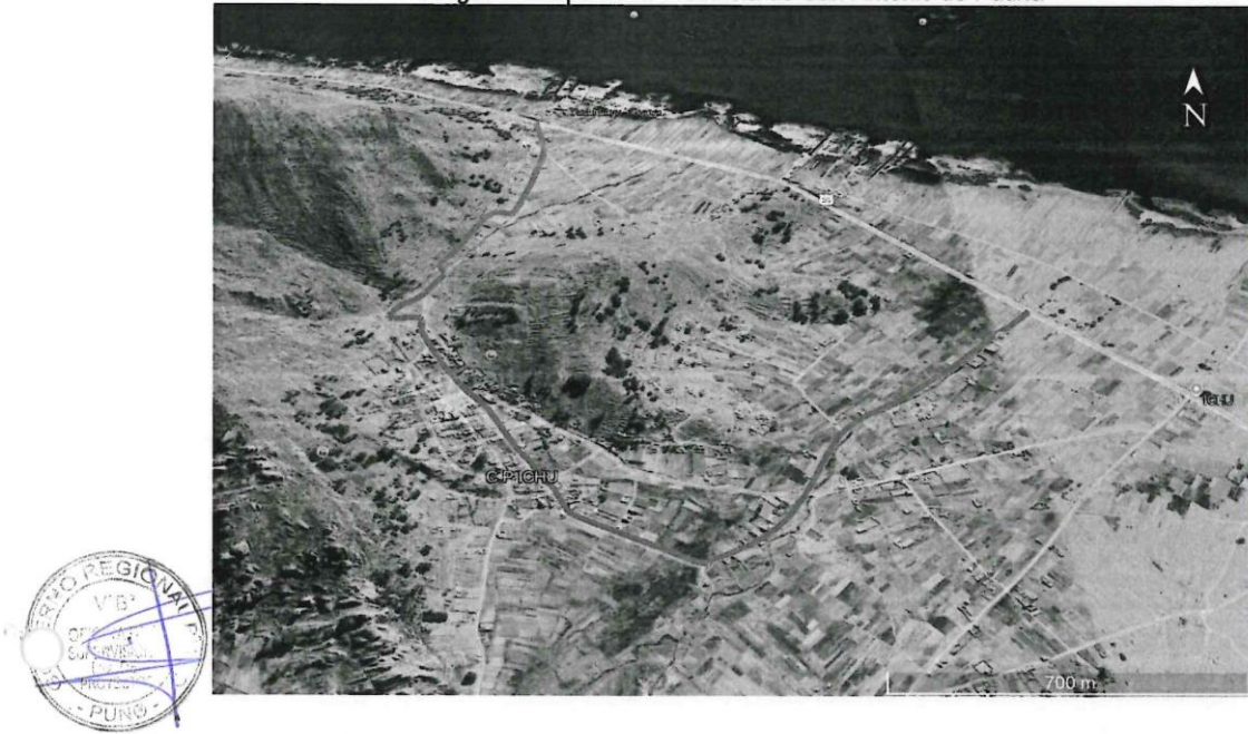
Imagen 1: Mapa de la Provincia de San Antonio de Putina

El terreno mencionado, cuenta con Partida Registral N° P48001535 de SUNARP – Zona Registral N° XIII Sede Tacna, el terreno cuenta con un área total de 13,087.18 m 2 y un perímetro de 477,998.00 ml, encerrado dentro de las siguientes medidas perimétricas y linderos.