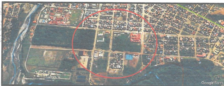
Mapa N° 2 Micro Localización del proyecto