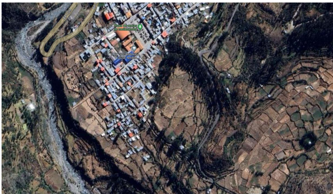
Ilustración 2. Ubicación de la I.E. José María Arguedas