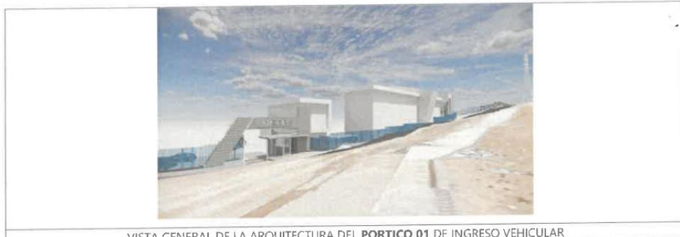
VISTA GENERAL DE LA ARQUITECTURA DEL PORTICO 01 DE INGRESO VEHICULAR