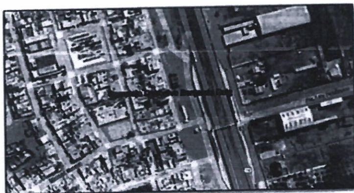
UBICACIÓN DEL PROYECTO

SUBGERENCIA DE OBRAS PUBLICAS, ESTUDIOS Y PROYECTOS