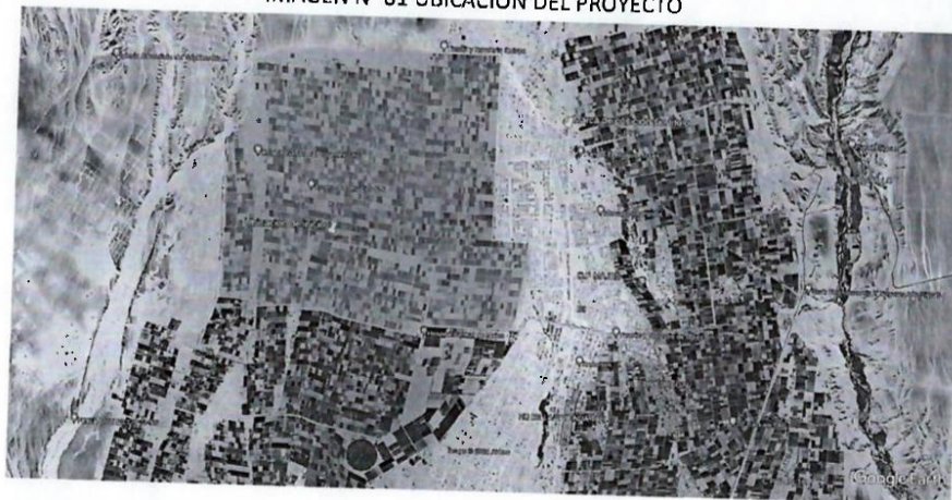
IMAGEN N° 01 UBICACIÓN DEL PROYECTO

La Municipalidad distrital de Majes ha priorizado la elaboración del estudio de pre inversión del proyecto en mención.