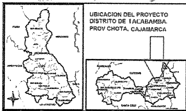
Imagen N° 01. Mapa del distrito de Tacabamba

Nivel de los estudios de preinversión, según corresponda Fecha de declaración de viabilidad, de ser el caso FICHA SIMPLIFICADA de : 17/09/2021