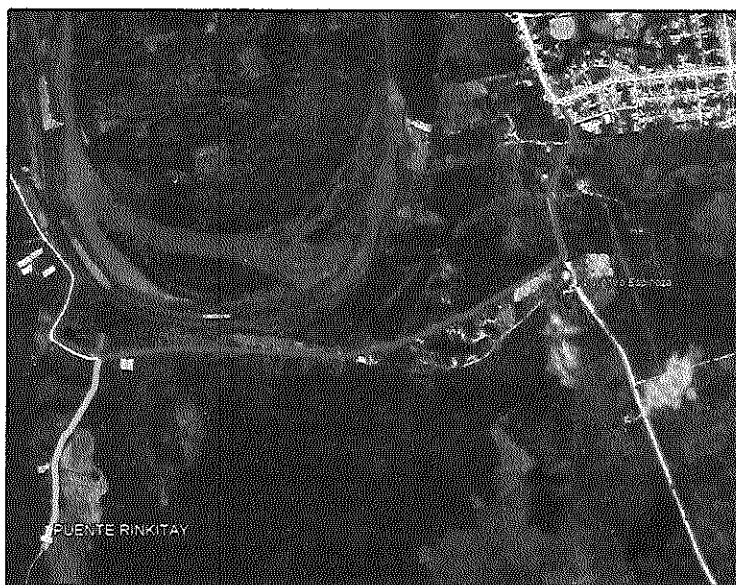
Distrito Nueva Requena – Acceso Rinkitay