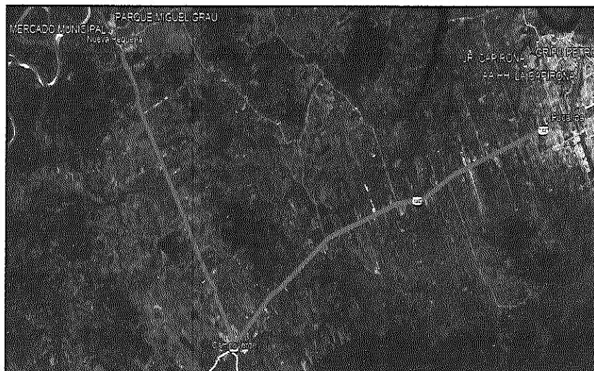
Pucallpa – Distrito de Nueva Requena