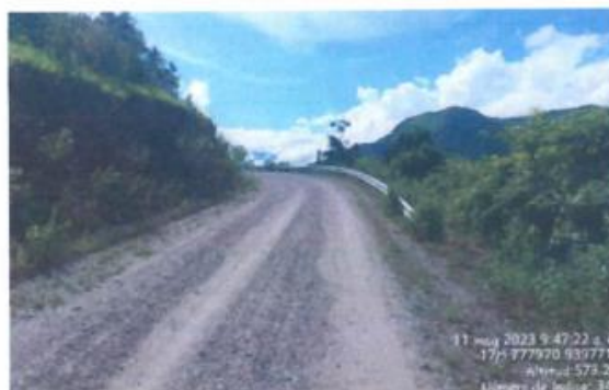
KM 02 + 192: Curva vertical con banquetas de seguridad