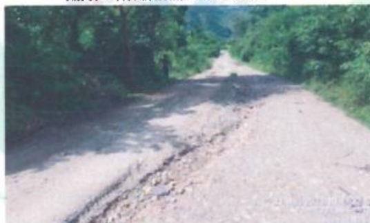
KM 01 + 009: Deterioro de la capa de afirmado en la vía