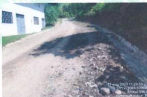
KM 00 + 157: Cunetas en mal estado