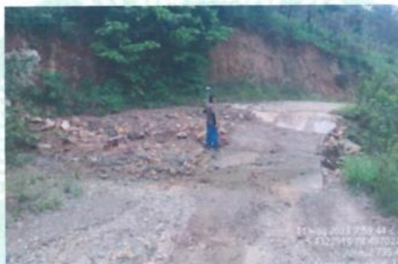
KM 5 + 184: Deslizamiento de tierra afectando al badén existente