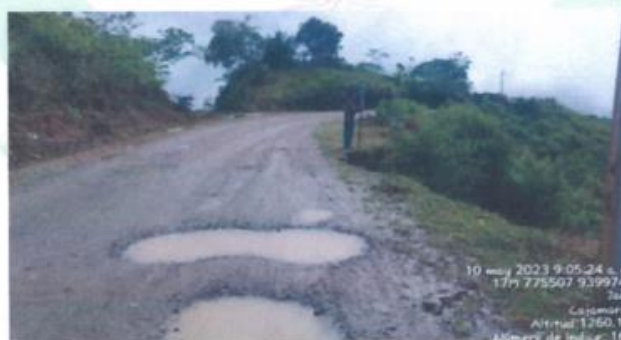
KM 10 + 178: Afectación de ciertos tramos de la vía por lluvias