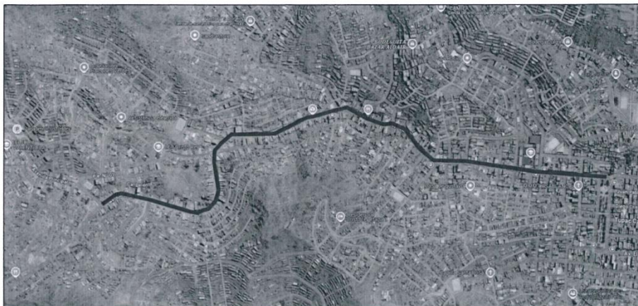
Imagen 1: Ubicación del proyecto en el Distrito de San Juan de Lurigancho.