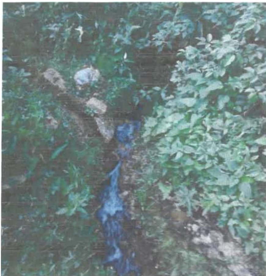
Foto 01. Canal de conducción de agua en terreno natural, el caudal es bajo y la escorrentía se da en canal labrado generando arrastre de suelo y pérdidas por filtración. Punto de confluencia de 2 captaciones.