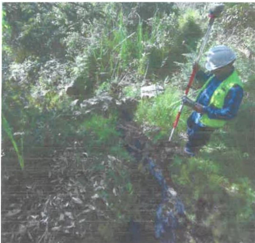
Foto 02. Canal labrado en suelo natural, con secciones irregulares, superficial.