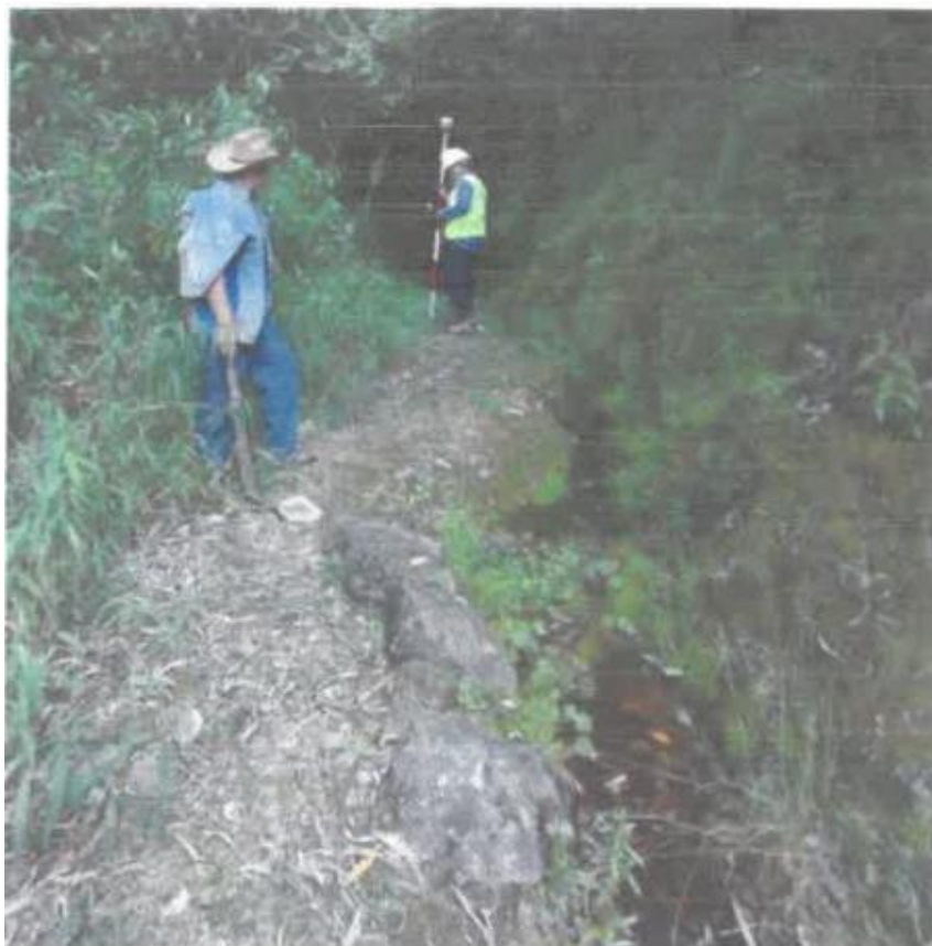
Foto 03. Canal labrado en suelo natural, con secciones irregulares, superficial, con sedimentos, hojarasca y hierbas lo que genera resistencia al desplazamiento del agua, reduciendo el caudal disponible y la velocidad de desplazamiento.

Se percibe caudales bajos de disponibilidad de agua, el canal de conducción es labrado sobre suelo natural y debido a las características propias con el tiempo ha generado secciones irregulares en su recorrido, la presencia de malezas, hojarascas y sedimento generan la reducción de la velocidad de desplazamiento generado a la vez pérdidas por filtración y reduciendo considerablemente la disponibilidad de agua para riego a los beneficiarios.